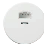
Takuttag DCL 2P+J med stickpropp FV Ei8 952 42