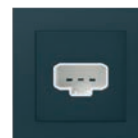
Vägguttag med stickpropp 2P+J PLUS SV Ei8 952 54