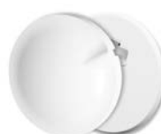
Täcklock för DCL takuttag Ei8 405 00