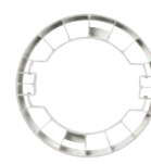
Förhöjningsram f DCL Lampputtag Ei8 952 43