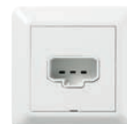
Vägguttag med stickpropp 2P+J RS FV Ei8 952 48