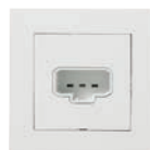
Vägguttag med stickpropp 2P+J PLUS FV Ei8 952 52

Den nya standarden införs den första april 2019, och det är fram tills dess tillåtet att följa såväl den befintliga standarden som den nya.