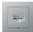
Vägguttag med stickpropp 2P+J PLUS ALU Ei8 952 53